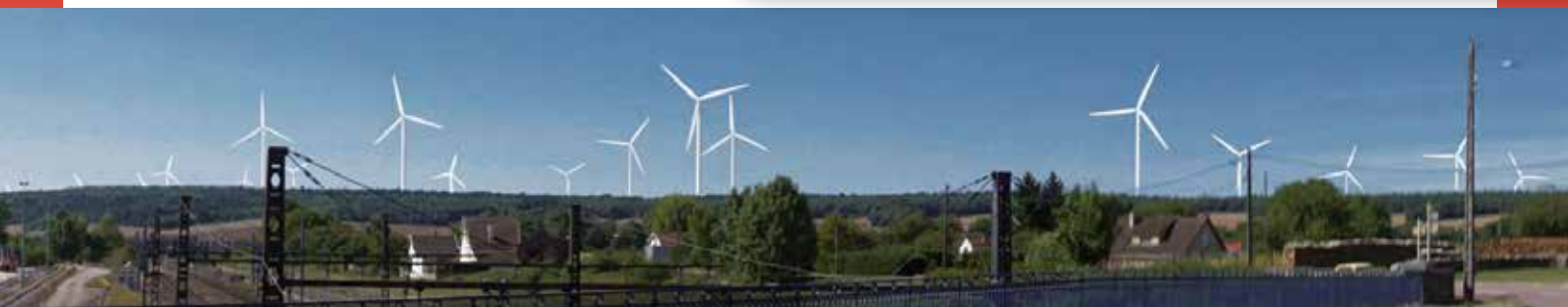
Vue du pont à Nuits-sur-Armançon (voie ferrée)