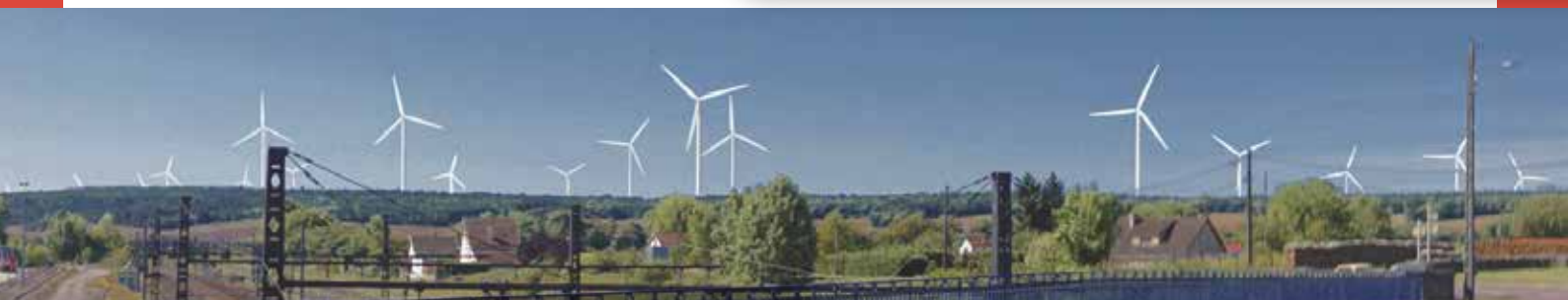
Vue du pont à Nuits-sur-Armançon (voie ferrée)