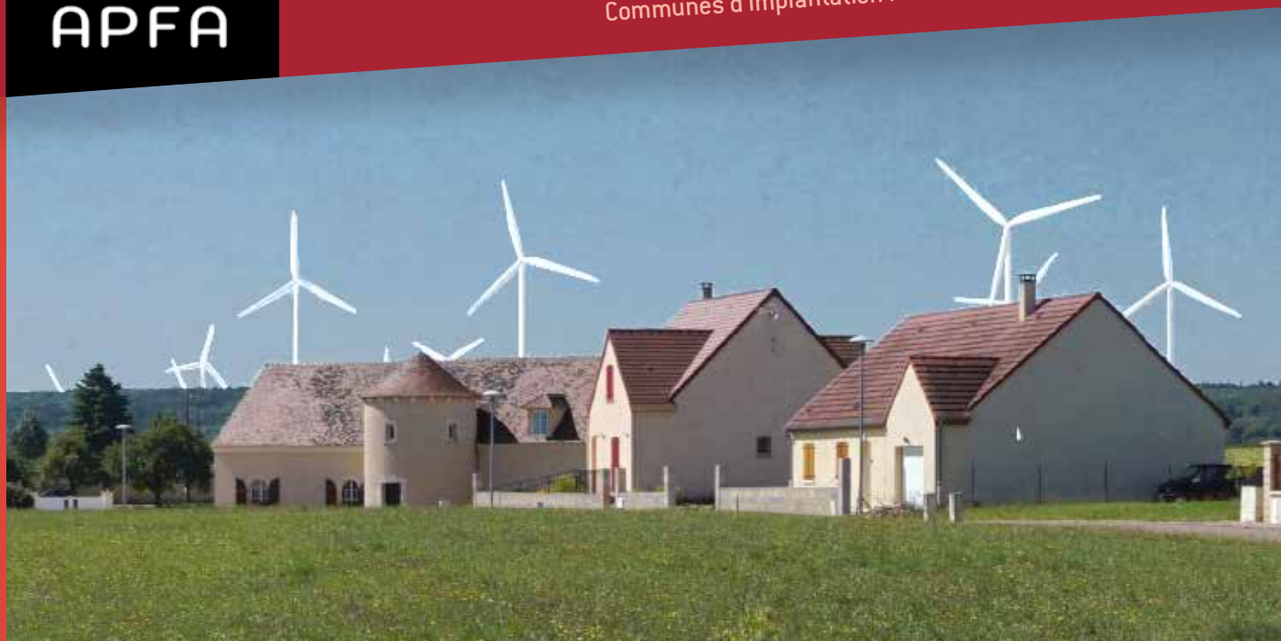
Vue du lotissement de Nuits-sur-Armançon

Communes d'implantation : AISY / CRY / NUITS - Promoteur : WPD